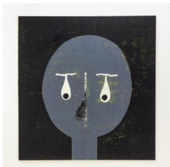
You Know Who You Are (Because I Don't Know Who You Are!) 2015, acryl en printinkt op canvas 188 bij 179 cm

Gekocht voor 10.000 euro, bij galerie Willem Baars Projects in Amsterdam